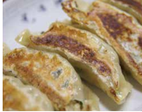
農業から抽出されたギョウザは食べやすい一口サイズで焼き色がついて18日、日本貿易管理センター提供

中国国内への物品輸出入を管轄する日本貿易管理センターは16日、中国から製造輸入された農薬用殺虫剤にギョウザが含まれていることを発表した。